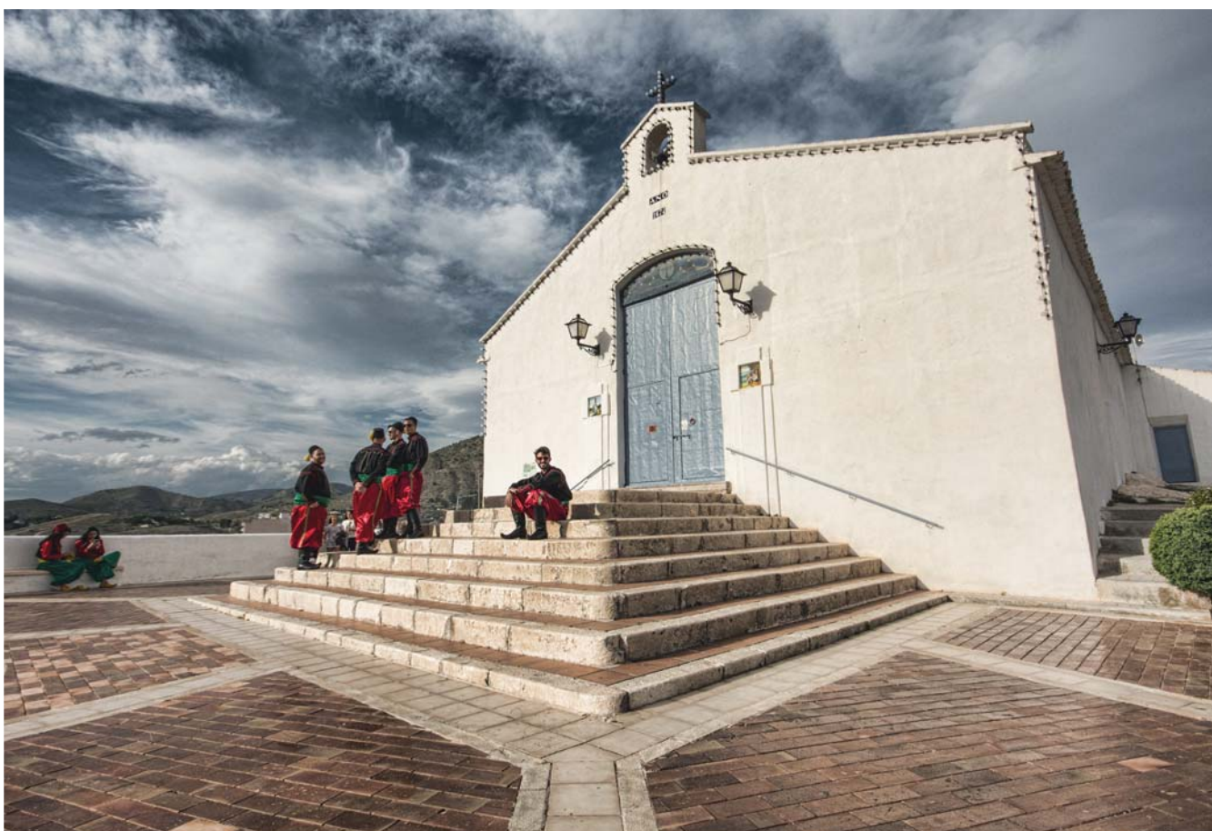
COMPARSA BERBERISCOS - Lema: RERTEP Autor: DANIEL MONTESINOS MOLTÓ