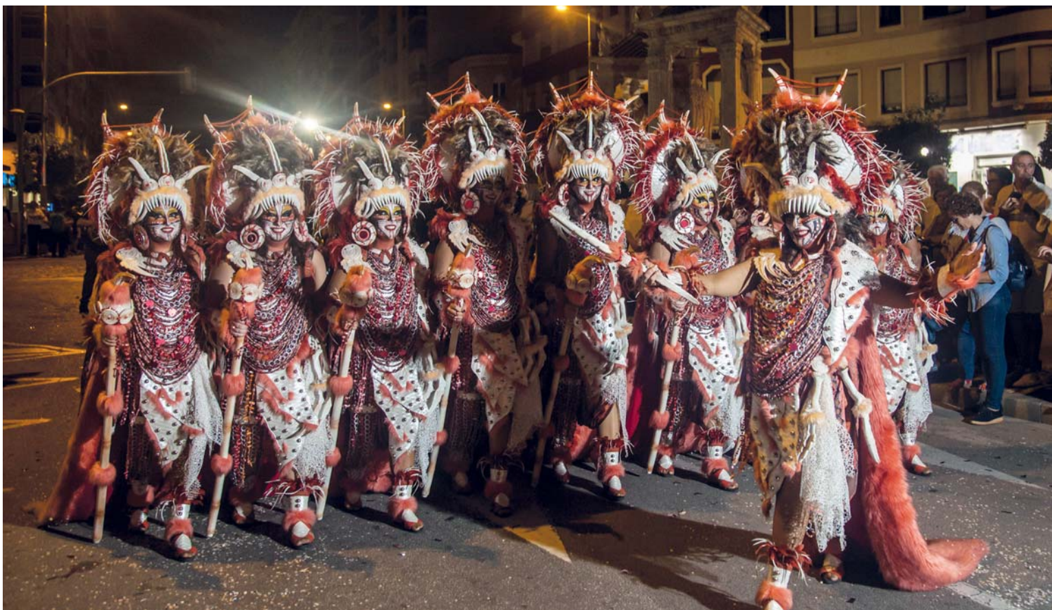
Comparsa Mora de la Villa, mejor traje