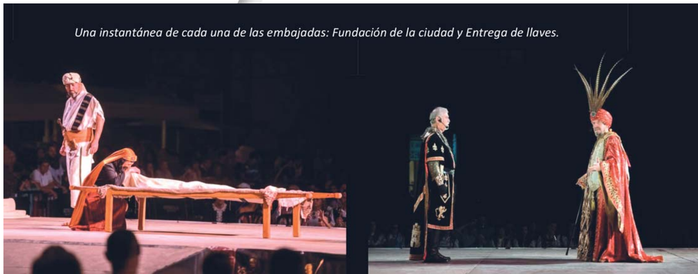
Una instantánea de cada una de las embajadas: Fundación de la ciudad y Entrega de llaves.

año ha tenido que superar innumerables dificultades burocráticas, que han provocado una mayor unión entre todos los festeros y festeras, en torno al lema: