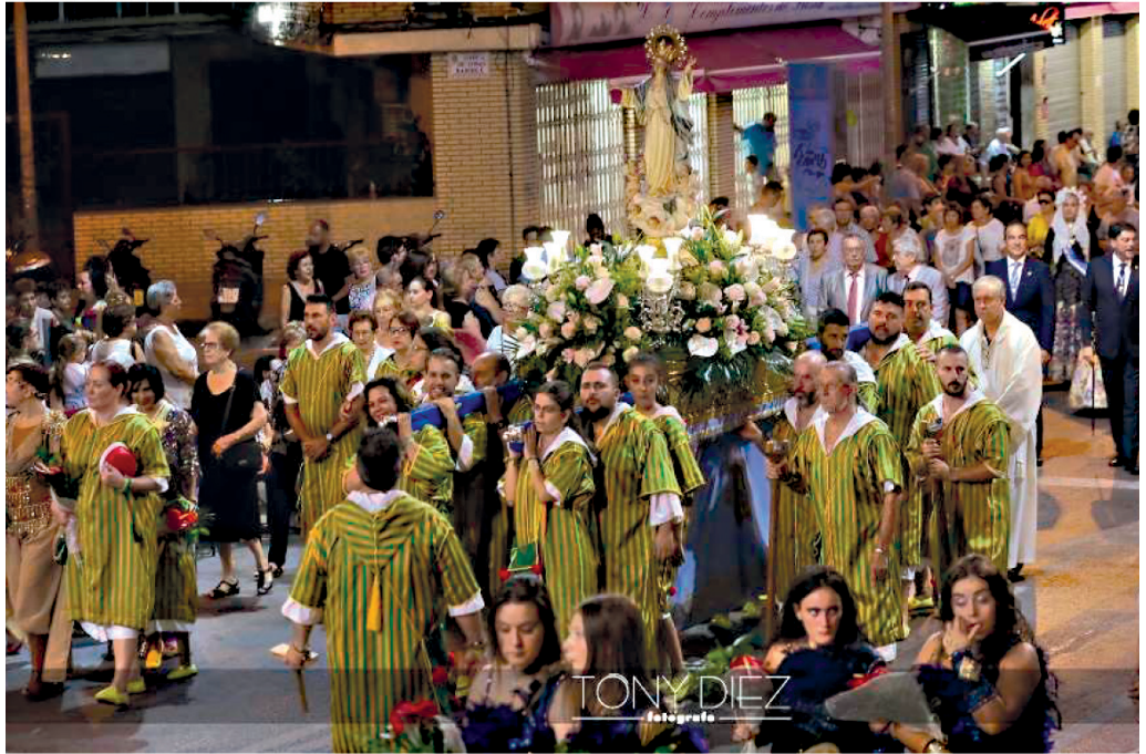
Imagen de la Procesión en honor a la Virgen de la Asunción.

Tras descansar, Altozano amaneció el sábado 17 con la embajada cristiana infantil, y media hora más tarde la