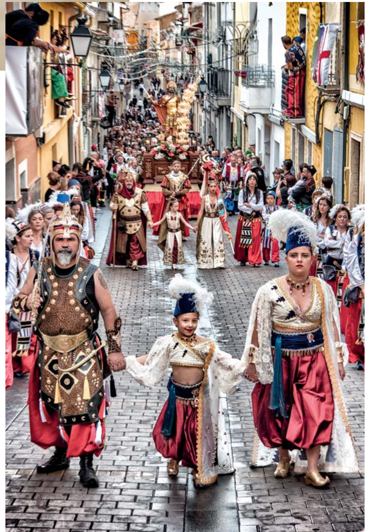
COMPARSA MOROS BEDUINOS - Lema: JOANNA Autor: JUAN PEDRO VERDÚ RICO