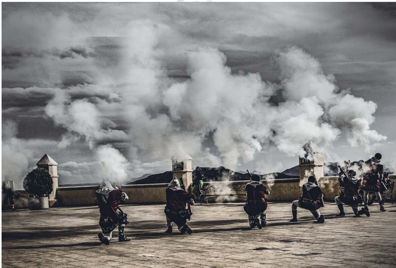
COMPARSA VIZCAINOS - Lema: VIANA