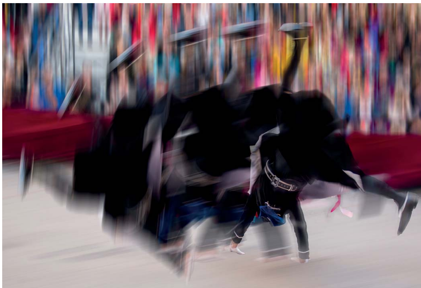
COMPARSA ESTUDIANTES - Lema: RERTEP