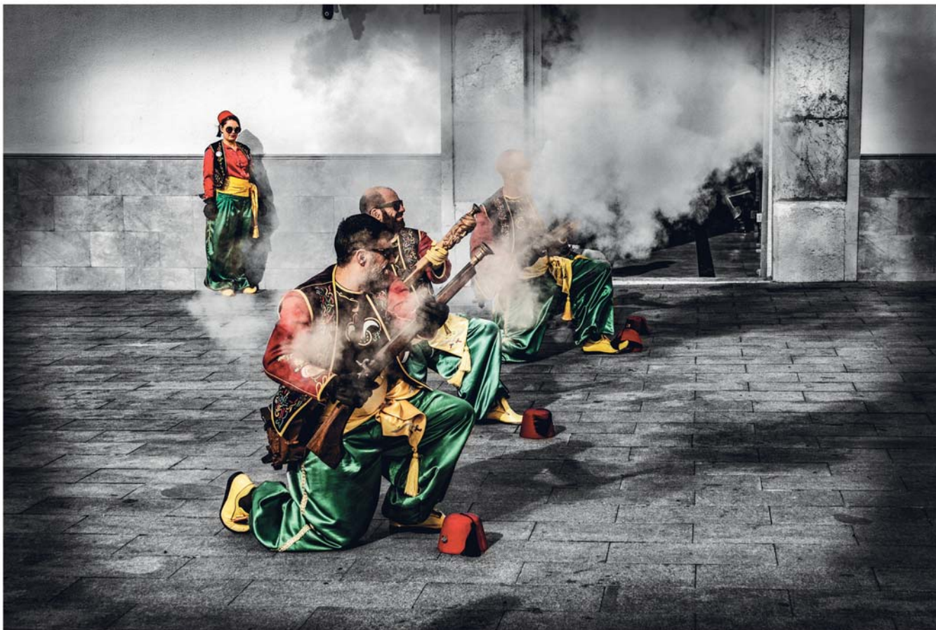
COMPARSA MOROS VIEJOS - Lema: VIANA Autor: JOAQUÍN ANDRÉS HERRERO CHICO