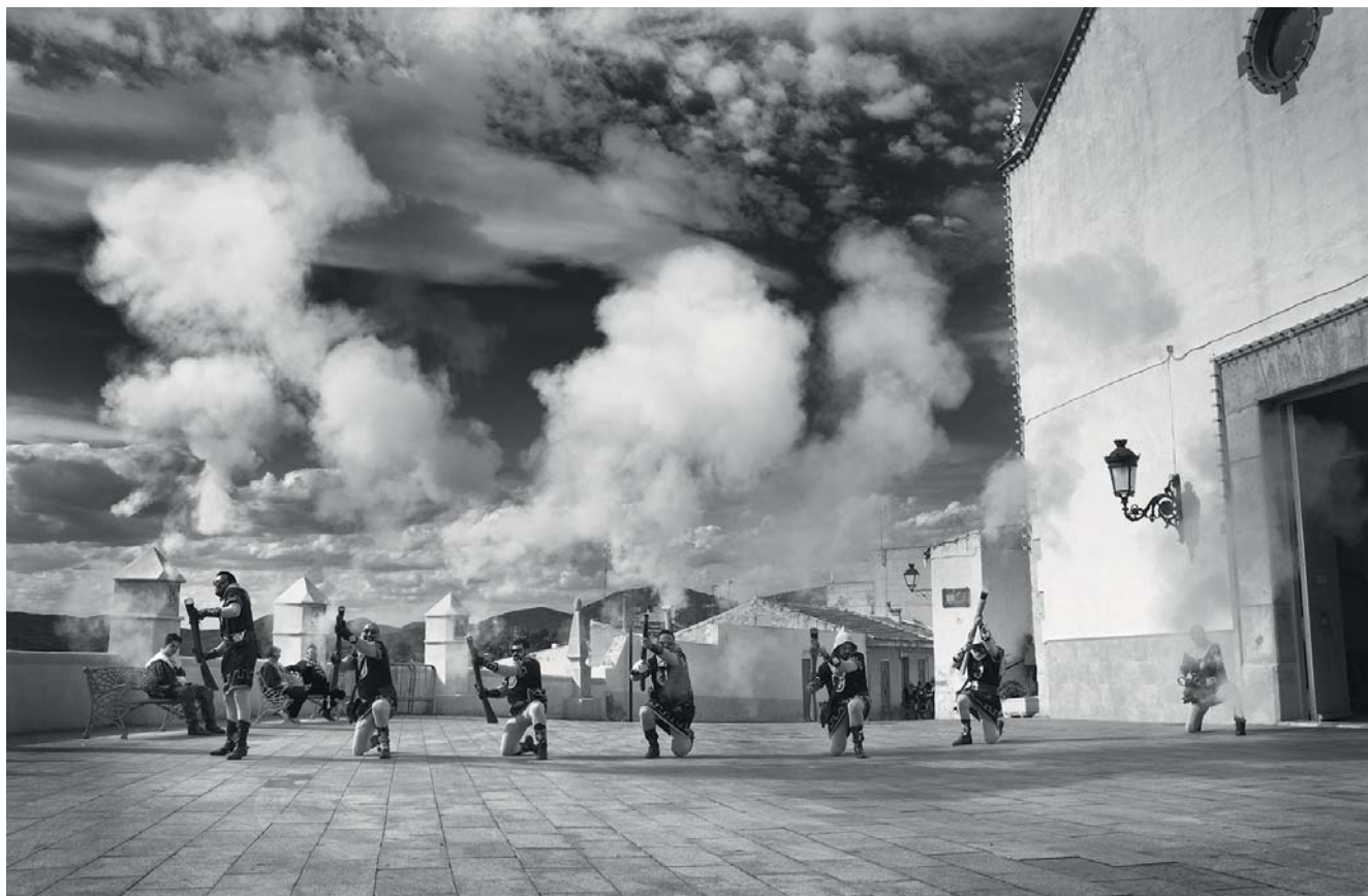
3º PREMIO- UNION DE FESTEJOS - Lema: DAIS