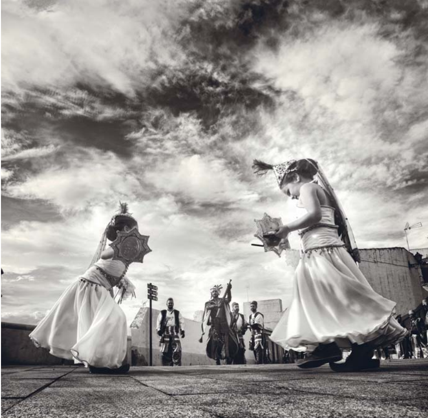
4º PREMIO-FOTO RICARDA Y CLICHÉ - Lema: CRESOL Autor: JOSÉ ANTONIO LÓPEZ RICO