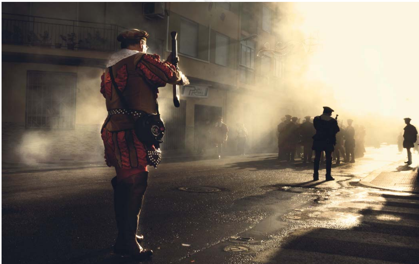
COMPARSA TERCIO DE FLANDES - Lema: LULU