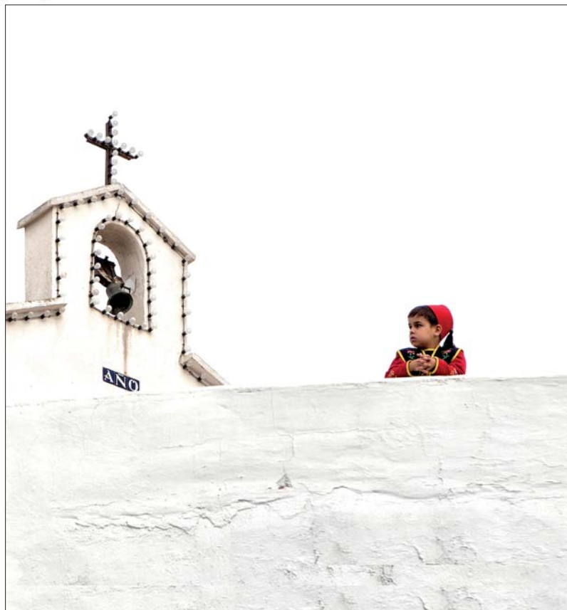
PREMIO ESPECIAL-METAL LUBE - Lema: ANTOÑIN Autor: ANICETO LÓPEZ HERRERO