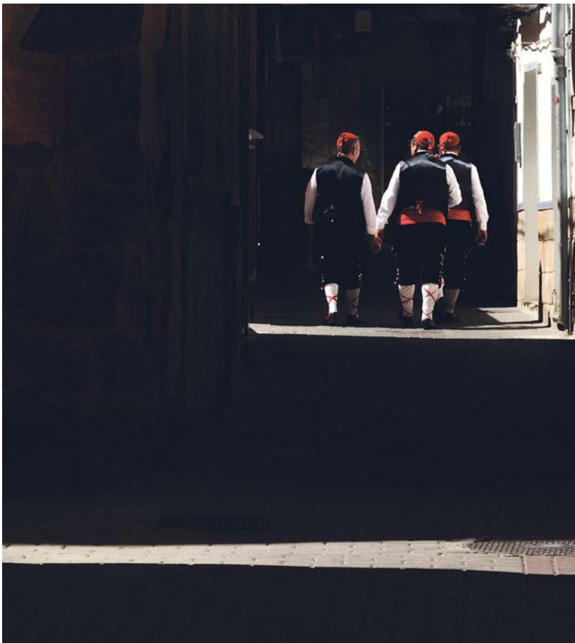
COMPARSA LABRADORES - Lema: TURBULA Autor: BLAS CARRIÓN GUARDIOLA