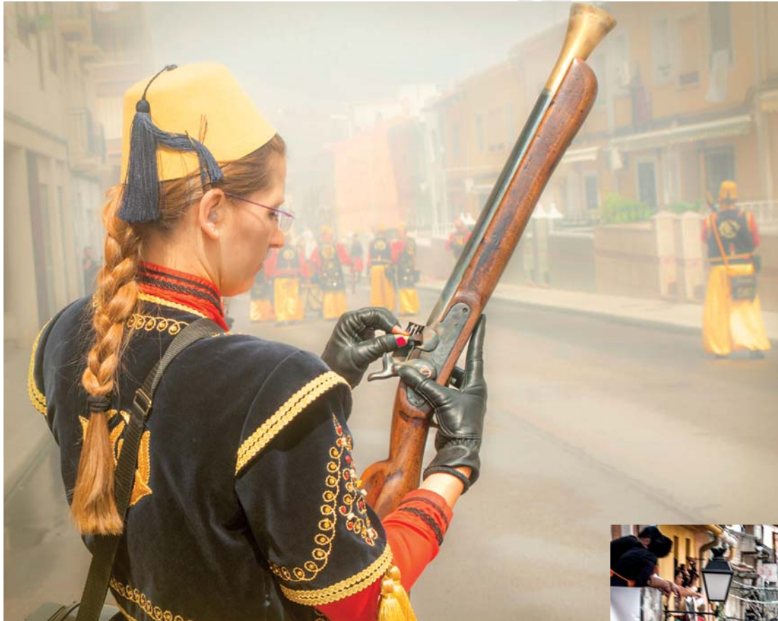
COMPARSA MOROS FRONTERIZOS Lema: MAULET Autor: FRANCESC AMORÓS RUZAFÀ