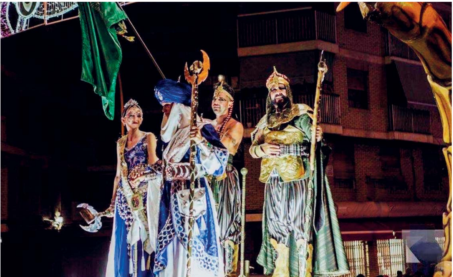
Capitanes adultos y Capitanes infantiles 2019.

El día 16 a las 11:00 horas arrancó el autobús dirección al Cottolengo, para hacer entrega a las residentes del Centro de los alimentos y ramos de flores que recogimos el día anterior tanto en la Santa Misa como en la Procesión. Pasamos una jornada festera cargada de emoción y sentimiento.