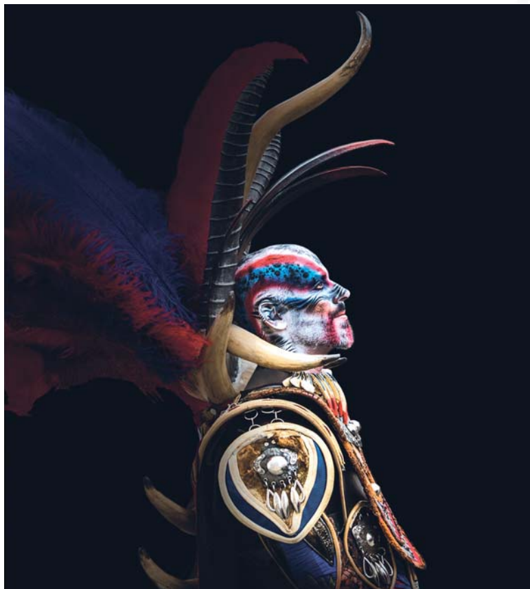
2º PREMIO-CAIXAPETRER - Lema: ADRI Autor: JOSÉ LÓPEZ GIMÉNEZ