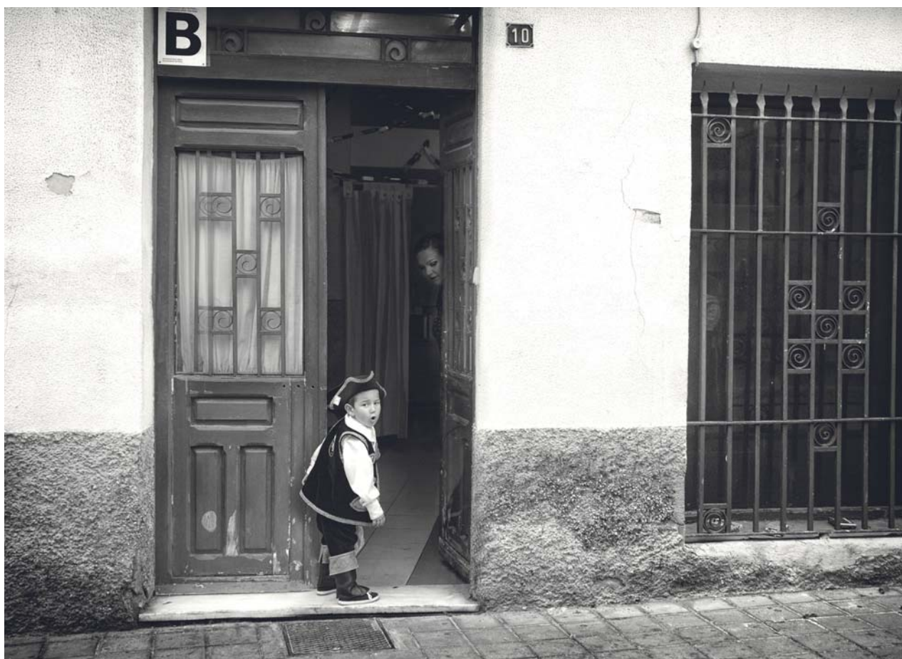
COMPARSA MARINOS - Lema: DAIS