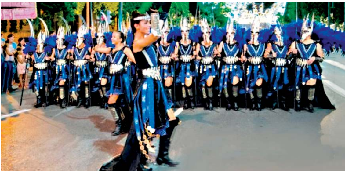
Suspendido el gran desfile, tuvimos que esperar al desfile de la Entrada Triunfal del Infante Alfonso, el lunes, para recorrer la Gran Vía.

El color y la música en los pasacalles y en el desfile del lunes 16 de septiembre (Entrada triunfal del infante Alfonso) fueron, un año más, señas de identidad de la Fiesta. Una Fiesta que este