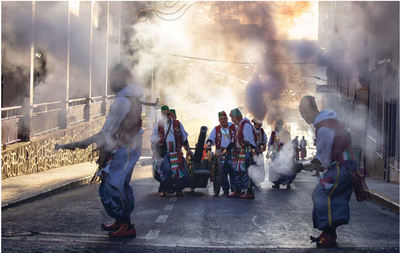
COMPARSA MOROS NUEVOS - Lema: MORATO